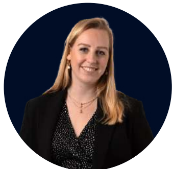
Féline vd. Does de Willebois Business support