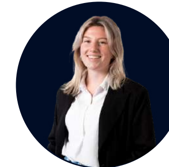
Romay v. Splunteren Business support